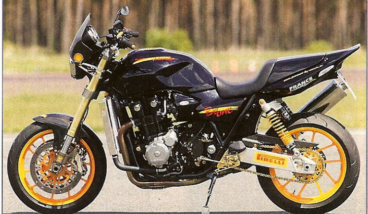
Christian Mende, An der Jägerhütte 14, 31020 Salzhemmendorf-Osterwald Tel. 05153/963001, www.powered-by-mende.de