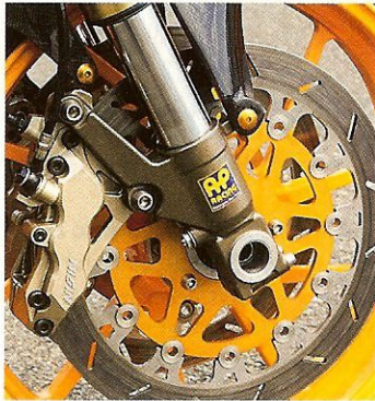
Das packt: Sechskolben-Nissins verbeißen sich in Bremscheiben von France Equipement

die Demontage der Ausgleichswelle macht sich nicht durch stärkere Vibrationen bemerkbar.